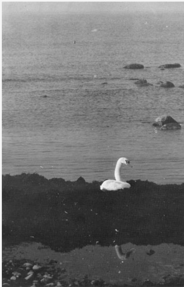
Svan vid Hörte.