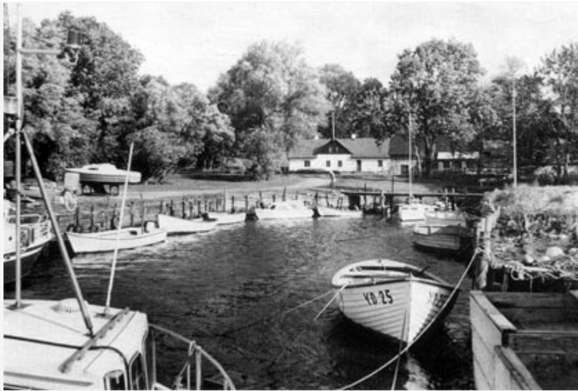
Hörte hamn vid Dybecksåns utlopp i Östersjön. Foto: Hans Sernert, 1984.