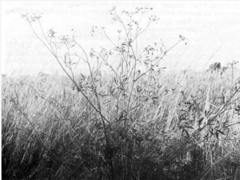
Ångsilja, Silaum silaus .

Re'n är skogen prydd med vårens kransar, Löf och blommor hänga i hvar topp. Trastar slå på mossebeklädda lansar, Liljor spira ur hvar tufva opp. Friska vindar löfwen sakta smeka, Luften fylls af doft så fin och ren; Kärligt skogens vilda dufvor leka. Solens låga hänger på hvar gren