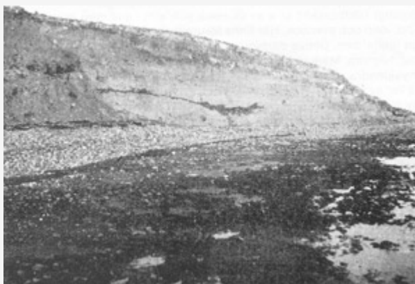
Av havet genomskuren strandvall vid Strandklint. Foto: Bror-Magnus Vifot, 1943.

STRANDEN söder om Dybeck var bar utan skär, uppkastad av sand och beströdd med kullerstenar. Landskanten vid stranden var uppkastad med klappur, sand och tång flodvis, vilka formerade en liten lantborg, ifrån vilken stranden nedföll i havet på ett bösseskotts bredd.