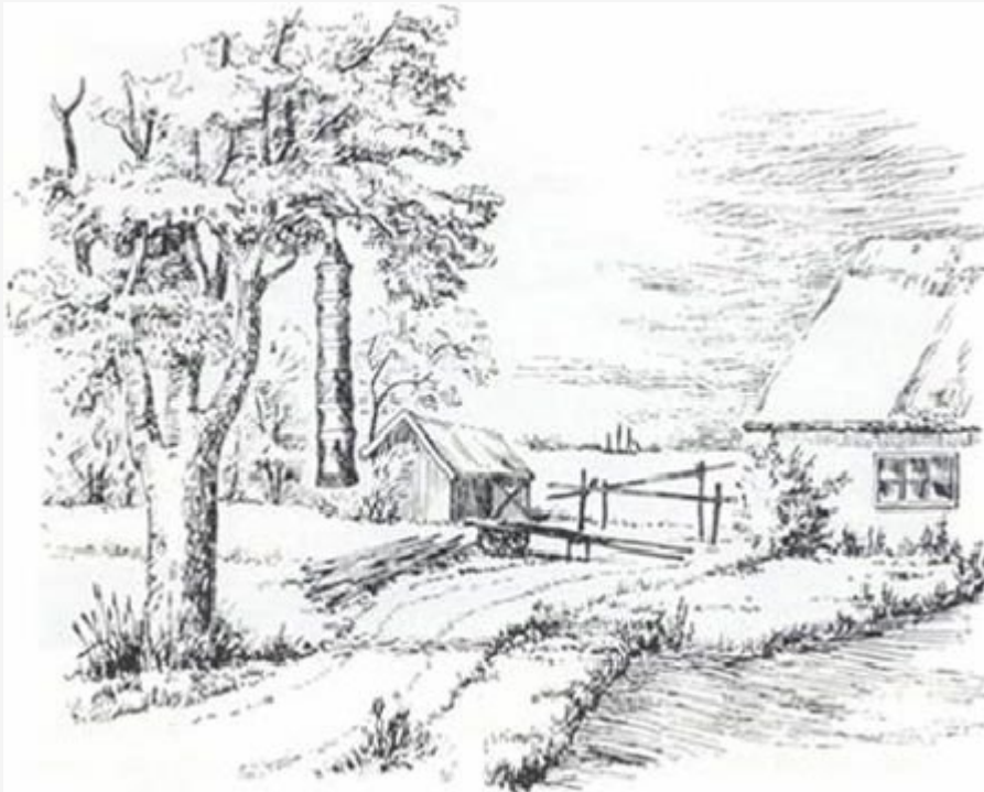
Från Hörte. Teckning av Albert Eskeröd, ur "Skånes kust" 1960.

Platsen för Hörte gamla fiskeläge är idag helt obebyggd. Men bygatan sträcker sig ännu genom dungen mellan fiskebodarna vid hamnen och parkeringsplatsen. Utsikten uppe på platån vid kustvägen – just i det hörn där ruiner efter ett medeltida upplagshus finns kvar under markytan. Här växer ännu rikligt med apel och körs, fläder och snöbär samt en hel mängd blommor som hör hemma i den skånska gammeldags trädgården, "haven". Men alla de gamla fiskarhusen, som var byggda av lera och hade stråtak är numera borta. De försvann i den s.k. Backafloden eller novemberstormen, som spolade bort dem med en hög svallvåg natten till den 13/11 1872.