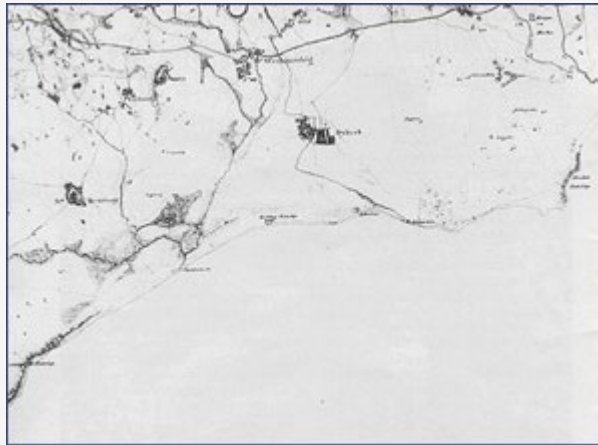
Detalj ur: Skånska rekognosceringskartan 1812 och 1815-1820.

och bildar hedmark. Detta kan man tydligt se på Skånska rekognosceringskartan 1812 och 1815-1820.