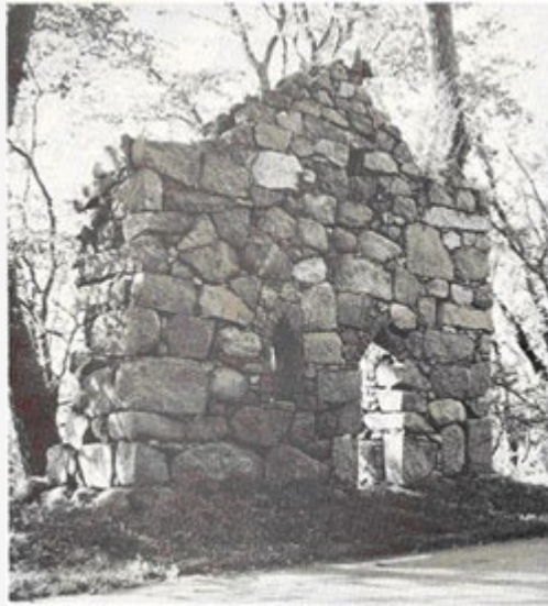
Ruinen vid Hörte.

Not till föregående sida: Denna dikt tillkom en lördagskväll i september 1972 på "Utsikten" vid Hörte efter att man i bilradion spelat Ludwig van Beethovens Pastoralsymfoni (nr 6), andra satsen med titeln: "Scen vid bäcken", många mil från Heiligenstadt utanför Wien, där denna musik tillkom sommaren 1808.