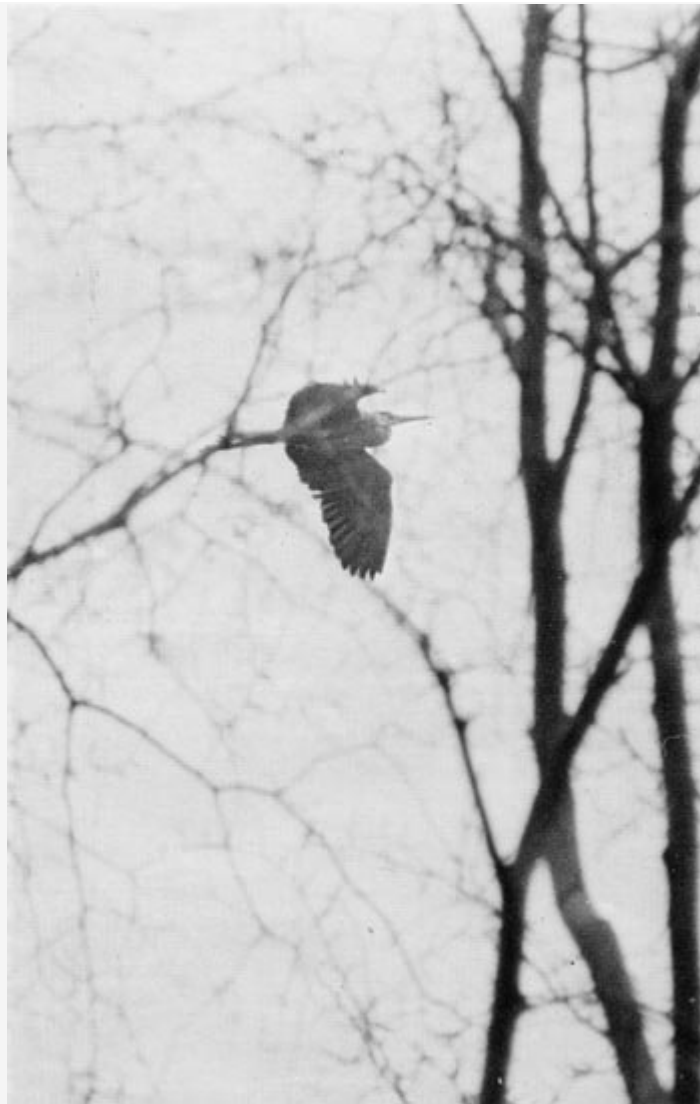
Häger över Hörte.